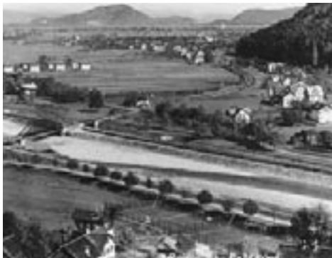
Tennisanlage am Breiten Wasen, 1927 bis 1967