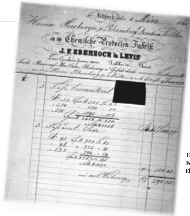
Eine Rechnung der Feldkircher Chemiefabrik Ebenhoch