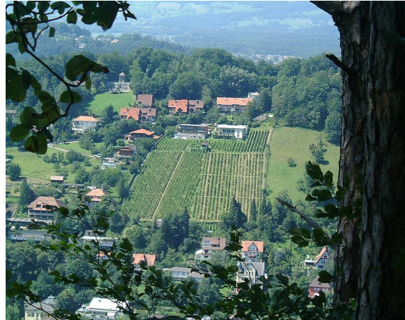
Foto: Blick vom Känzle auf den Weinberg am Ardetzenberg

Wir gehen an der Polytechnischen Schule vorbei, biegen bei der Ampel rechts ab, folgen der Churerstraße und gehen weiter durch die Kapfchlucht. Von hier haben wir einen besonders beeindruckenden Blick auf die auf den Felsen der Illschlucht gebauten Häuser des historischen Feldkircher Stadtviertels „Im Kehr“. Unser Weg führt uns weiter entlang der Ill an der alten, geschichtsträchtigen Vereinigungsbrücke vorbei. Nach dem nur Bussen vorbehaltenen Tunnel queren wir rechts die Straße und steigen den romantischen, aus dem Felsen gehauenen Fußsteig zum „Veitskapf“ hinauf.