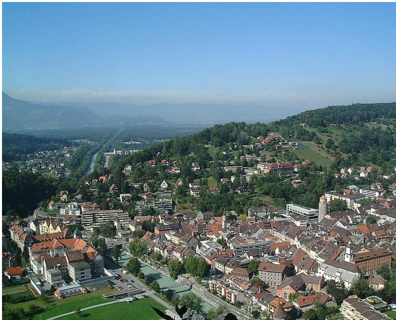
Foto: Blick vom Stadtschrofen Richtung Illspitz

Am Ende der Duxgasse halten wir uns links und gehen am Letzehof, der heute als buddistisches Zentrum dient, vorbei, bis uns ein Wanderschild links zum Stadtschrofen weist. An diesem Aussichtspunkt angekommen, werden wir mit dem schönsten Blick auf Feldkirch belohnt. Auf dem Rückweg halten wir uns an der ersten Wegkreuzung links und erreichen bald wieder die Straße, der wir abwärts folgen. Nach etwa 100 Metern zweigt links der Wanderweg zur Felsenauschlucht ab. Bis in die Innenstadt Feldkirch sind es dann nur mehr wenige Minuten.