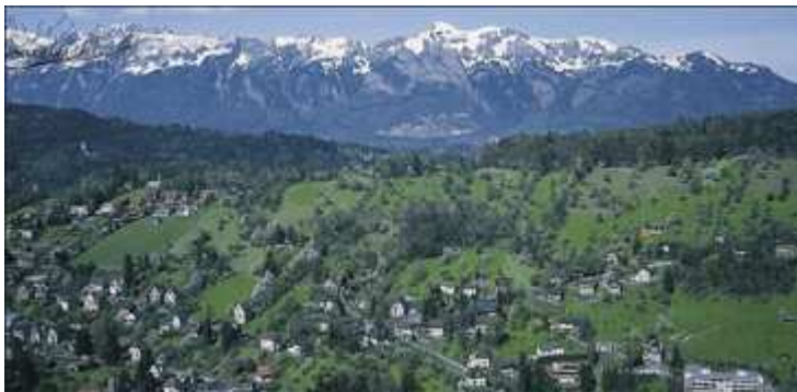
Foto: Blick auf den Ardetzenberg und den Hohen Kasten

1 1/2 - 2 Std. je nach Auf- und Abstieg und Rundwanderoute.