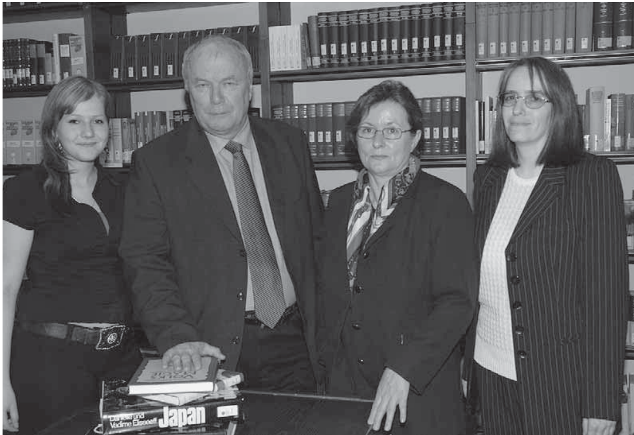
Die Mitarbeiter der Stadtbibliothek (2006)