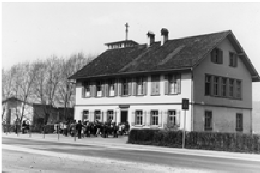
Schüler warten vor dem Schulhaus auf Einlass. Ca. 1970

Bauzustand des Schulgebäudes das wichtigste Argument für einen Neubau. Der Zustand der Sanitäreinrichtungen wurde als katastrophal und die uralte Holzstiege in den oberen Stock als bedenklich bezeichnet. Es herrschte auch größte Feuergefahr in diesem Holzgebäude. Man hatte seit einem geringfügigen Umbau im Jahre 1928 auch kaum bauliche Verbesserungen vorgenommen.