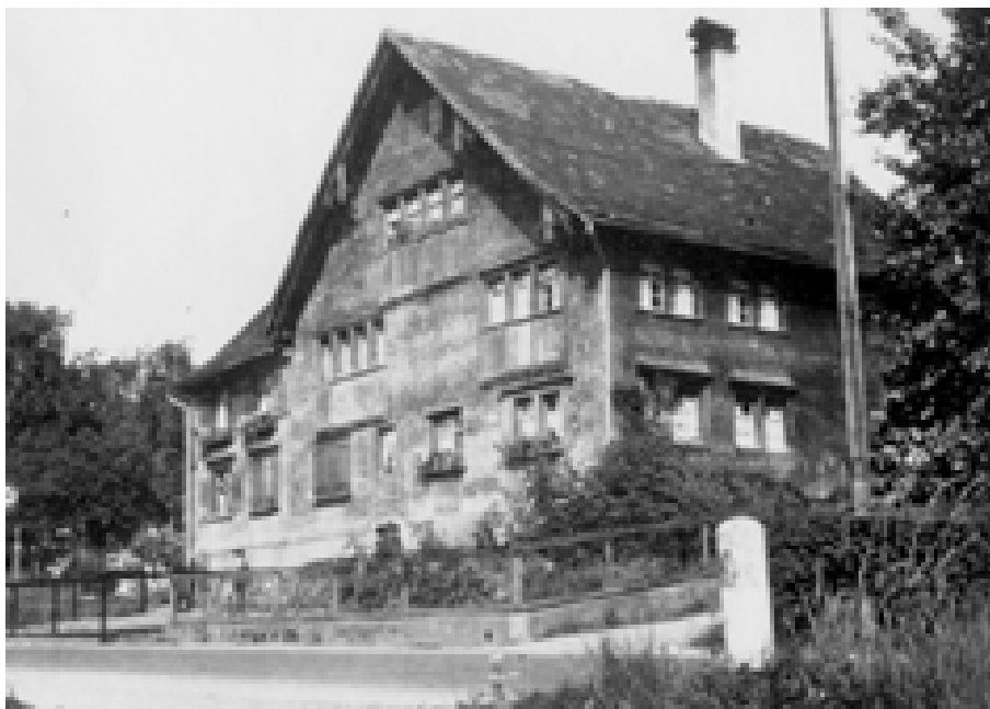
Im „Eisenegger“ Haus an der Ecke Liechtensteinerstr./Letzestr. befand sich die erste Schulstube.