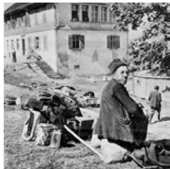
Ein armenischer Flüchtling 1945, im Hintergrund das alte Schulhaus.

Scharen von Ausländern, Zwangsarbeitern und Flüchtlingen, zogen in den letzten Kriegstagen durch Tisis in Richtung Grenze. In langen Reihen standen sie am Schweizer Zollamt und hofften vergeblich auf Einlass. Sie fanden in den leer stehenden Baracken und der nun von der französischen Militärverwaltung offiziell als Ausländerlager deklarierten Volksschule Tisis Unterkunft. Alle Räume der Schule, mit Ausnahme der Kapelle, dienten den Flüchtlingen als Wohn- und Schlafquartier. Um Arbeit und einen Verdienst zu erhalten, eröffneten sie kleine Handwerksbetriebe. Aus dem Feuerwehrhaus wurde eine Autowerkstätte, in der Kegelbahn des Gasthaus Löwen gab es eine Schusterwerkstätte mit 15 Mitarbeitern. In der Schule wurde ein Künstleratelier, eine Nähstube sowie eine Werkstätte für Spielzeugherstellung eingerichtet. Trotz aller Bemühungen durch den Feldkircher Bürgermeister Mähr und die Landesregierung blieb die Schule auch nach dem offiziellen Schulanfang im September