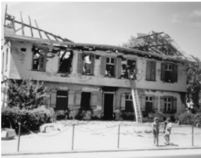
Das zerstörte Schulhaus nach dem Brand vom 16.6.1973