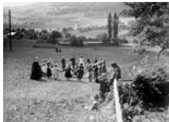
„Tummelplatz“ in den 20er Jahren; im Hintergrund der Tisner Weiher

1883 wurde ein neues Stockwerk, bestehend aus Strickwänden, auf das Erdgeschoss aufgebaut. Dort befand sich ein großes Schulzimmer im Ausmaß von 90 Quadratmetern, ein Mittelgang und zwei Räume nach Nordosten. In einem dieser Räume war die Gemeindeganzlei von Tisis untergebracht, das andere Zimmer diente als Schulkapelle, in der an den Werktagen die Schulmesse gelesen wurde.