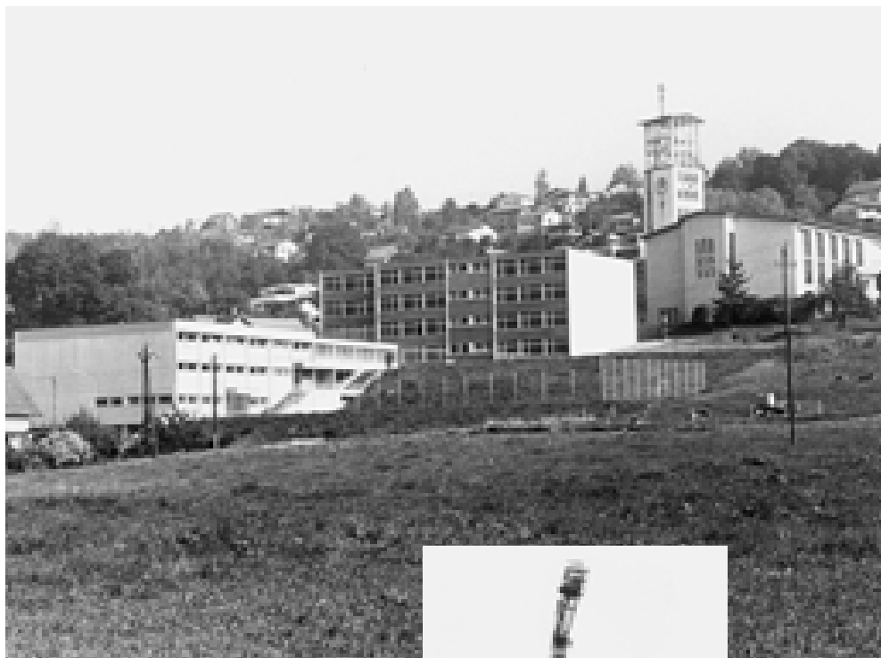
In der Rekordbauzeit von 18 Monaten wurde die neue Schule errichtet und im September 1974 eröffnet.