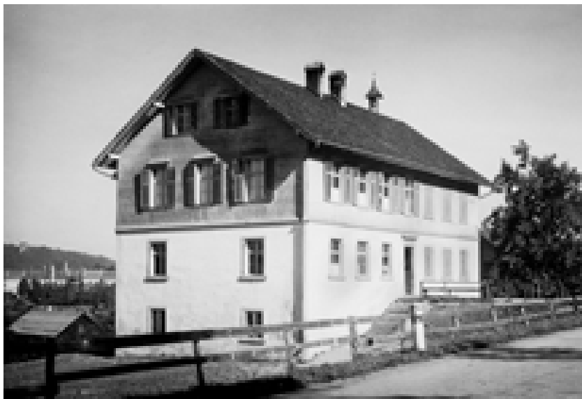
Das alte Tisner Schulhaus mit Schulglocke auf dem Dach. Im Bildhintergrund das Exerzitienhaus. Ca. 1955

Seit 1886 erhielten die Schülerinnen hauswirtschaftlichen Unterricht. Als Grundausrüstung ließ die Gemeinde bei Tisner Tischlern zehn Nähtische sowie Bänke für Strickerinnen anfertigen. 1919 wurde die gegen Nordosten gelegene Wohnung in eine größere Schulkapelle, die andere in eine Gemeindeganzlei und ein Vereinszimmer umgebaut. Im oberen Stock wurde ein zweites Klassenzimmer eingerichtet.