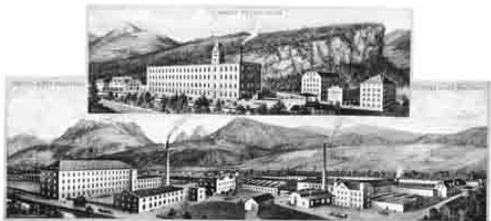
CARL GANAHL & CO. BAUMWOLLSPINNEREIJEN. BAUMWOLLWEBEREIJEN. FELDKIRCH

Betriebe des Unternehmens Ganahl um 1900.