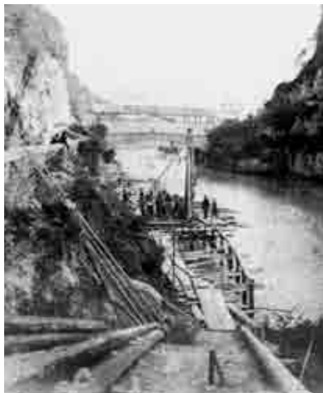
Eisenbahnbau in der Illschlucht im Jahre 1871

Die Sparkassa erlebte einen beachtlichen jährlichen Zuwachs an Finanzmitteln, sodass sie nach 30 Jahren Aufbauarbeit Kredite für öffentliche Bauvorhaben wie den Bau der Volksschule gewähren konnte. Zur Linderung der Wohnungsnot errichtete die Sparkassa 1888 das erste Miethaus in Feldkirch, das so-