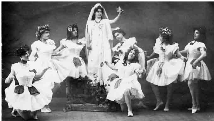
Faschingsfeier der Liedertafel vom 15. Februar 1914. Eine sehr maskuline Ballettruppe zeigt ihr Können und ihre Schönheit.

Beziehungen gab es auch zu den Sängern jenseits des Rheines. Die Liedertafel traf sich mit Sängerguppen im Schweizerischen Rheintal, nahm regelmäßig an den dortigen Sängerfesten teil und luden ihre Schweizer Nachbarn gerne ein. Ein besonders enges Verhältnis gab es zum Männerchor „Frohsinn“ in Glarus. Bei einem Sängerfest in Sargans 1882 lernten sich die beiden Vereine kennen und sprachen Einladungen aus. Die Feldkircher besuchten Glarus, ein Gegenbesuch erfolgte. Man unternahm mit den Glarnern Ausflüge nach Maria Grün und Bludenz und gab ein gemeinsames Konzert.