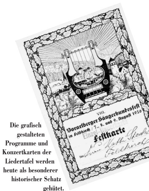
Die grafisch gestalteten Programme und Konzertkarten der Liedertafel werden heute als besonderer historischer Schatz gehütet.

Ein großer Erfolg war im Jahr 1930 das Singspiel „Frühling in Heidelberg“, das viermal wiederholt werden musste. Unterstützt wurden die Sänger durch ein 1920 von Lehrer Ritter zusammengestelltes Hausorchester.