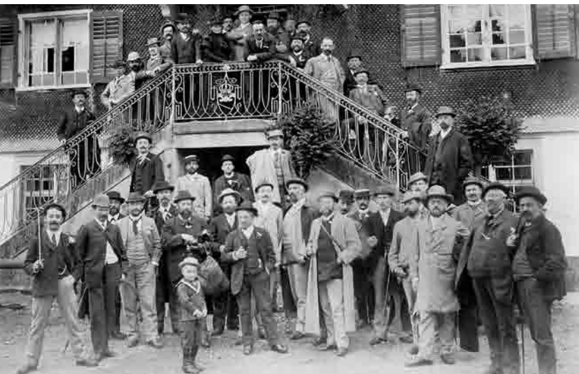
Jedes Jahr unternahm und unternimmt die Liedertafel einen Sängerausflug. Sängerschaft vom 9./10. Juni 1894 nach Hittisau Gruppenfoto vor dem Gasthaus Krone am Kirchplatz