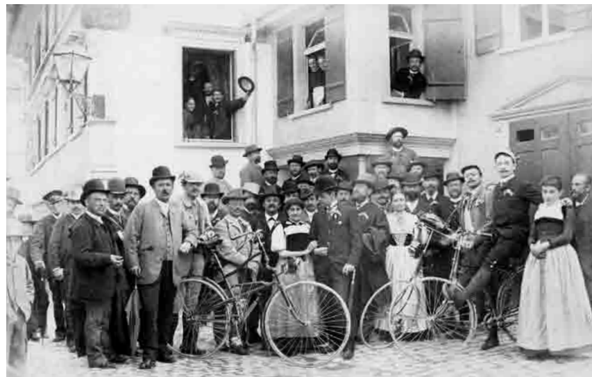
Sängerschaft vom 30. und 31. Mai 1891 nach Appenzell Besonders sportliche Mitglieder nahmen ihre Fahrräder mit.

Nach dem I. Weltkrieg wurden Kontakte zu Wiener Gesangsvereinen aufgebaut. So konzertierte 1923 erstmals auf Einladung der Liedertafel der Wiener Schubertbund und 1924 der Wiener Lehrer-a-capella Chor. Weitere Konzerte und Besuche der Wiener Chöre folgten. Die Beziehungen zu Jung-Wien, dem Nachfolger des Schubertbundes, existieren bis heute. Ein Besuch der Wiener Sänger in Feldkirch wurde von Filmchronist Dr. Himmer dokumentiert und ist auf dem Feldkirch-Film des Filmarchiv Austria festgehalten.