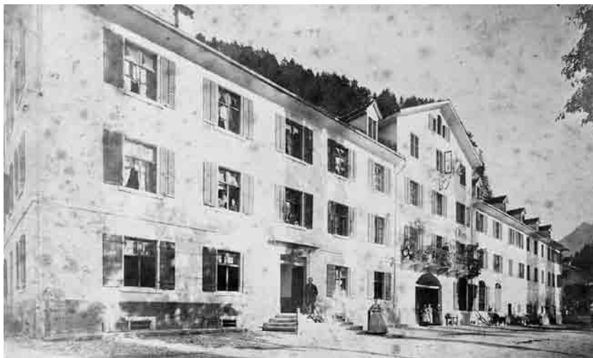
Das Gasthaus Engel in der Walgaustraße diente zeitweilig als Probelokal. Das Haus wurde später in das Stadtspital umgebaut.

Blickt man die seit 1862 geführten Mitgliederlisten der Liedertafel durch, so hat man ein „Who is who“ Feldkirchs vor sich. Bürger, Mitglieder alteingesessener Familien, Kaufleute, Honoratoren, ja sogar Bürgermeister waren Mitglieder der Liedertafel. Daneben gab es im 19. Jahrhundert zahlreiche höhere Beamte der Bezirkshauptmannschaft, des Gerichtes, des Finanzamtes, die während ihres zeitlich befristeten Aufenthaltes in Feldkirch zur Liedertafel kamen. Kurz vor ihrer Versetzung in andere Bezirksstädte in Tirol oder Trentino wurden sie mit einem „Valet“, einem von Gesang geprägten Abschiedsfest, verabschiedet.