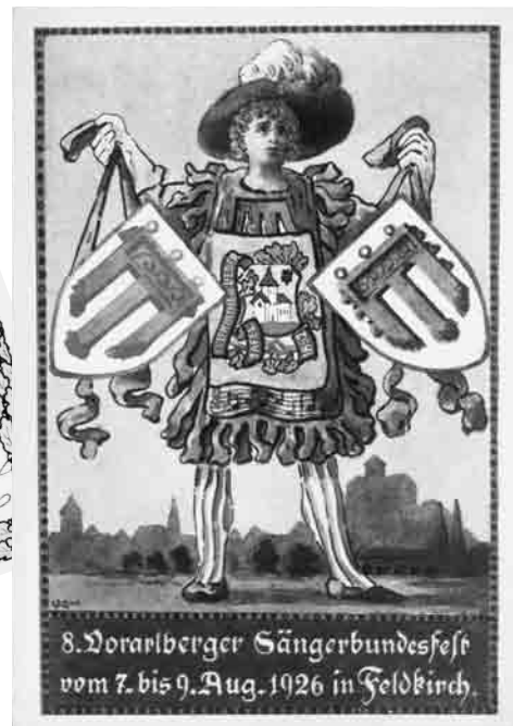
Postkarte anl. des Vorarlberger Sängerbundesfestes 1926 in Feldkirch.

Der Wappenherold trägt die Stadt- und Montforterfahne. Auf seiner Brust das bis heute in Verwendung stehende Vereinslogo der Liedertafel.