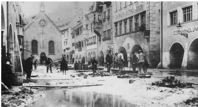
Im Gasthaus Ochsen befand sich für Jahrzehnte das Probenlokal der Liedertafel. Aufnahme des Gasthauses nach dem Jahrhunderthochwasser 1910. Die Aufräumarbeiten sind in vollem Gang.

Für nähere Informationen wenden Sie sich an Stadtarchivar Mag. Christoph Volaucnik (Tel. 304-1150, archiv@feldkirch.at ).