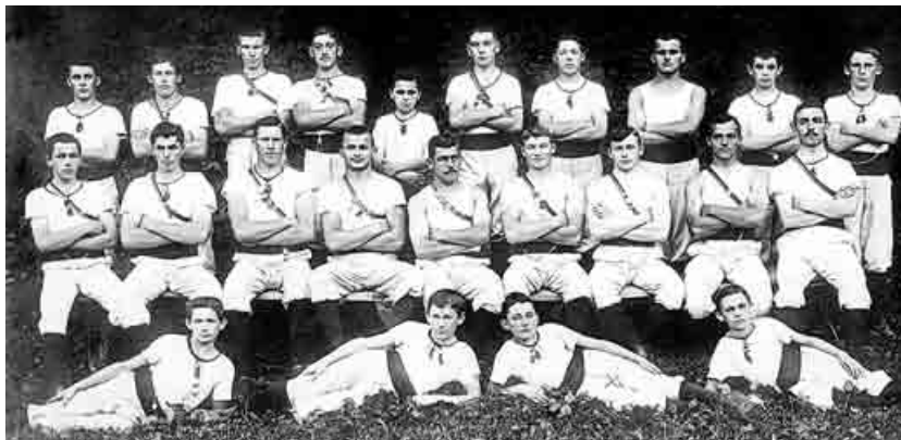
Ein Gruppenfoto aus der Frühzeit der Turnerschaft Gisingen, 1911