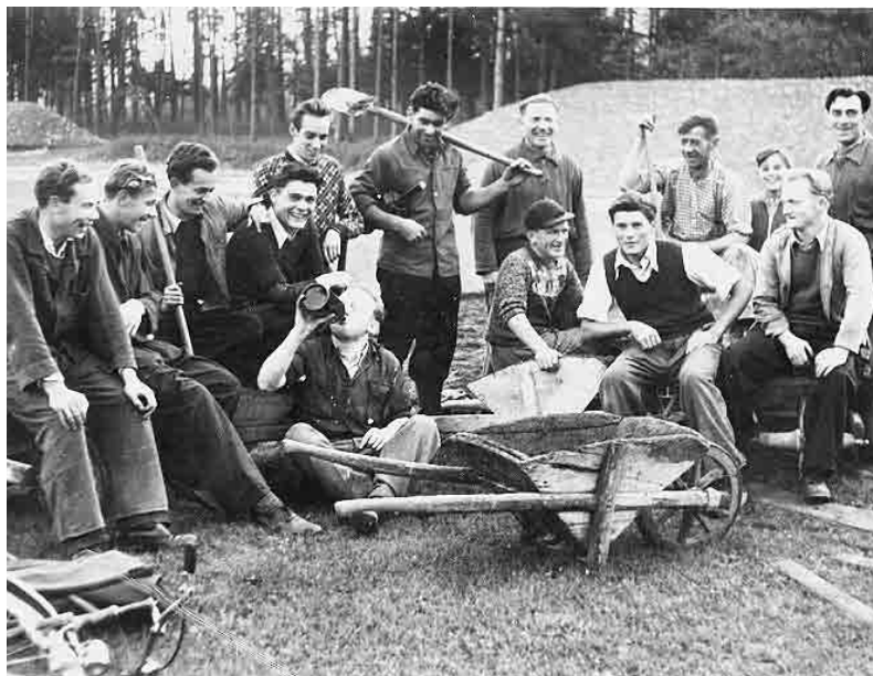
Mitglieder der Turnerschaft halfen beim Bau des Waldstadions Gisingen 1953/54 tatkräftig mit.

Diese Sportart entwickelte sich in Gisingen sehr erfolgreich. 1956 wurden im neuen Stadion die österreichischen Juniorenmeisterschaften in der Leichtathletik abgehalten, im folgenden Jahr der Leichtathletik-Länderkampf der Jugend aus Tirol, Salzburg und Vorarlberg. Die Erfolge des Vereins, die guten Trainer und die idealen Trainingsbedingungen sorgten für eine starke Zunahme an Mitgliedern. So stellte der Verein 1959 beim Landesjugendturnfest 110 Teilnehmer und wurde überlegener Sieger in den diversen Bewerben.