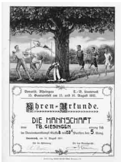
Von den Erfolgen der Gisinger Turner zeugen teils kunstvoll gestaltete Urkunden, wie diese aus dem Jahre 1931.