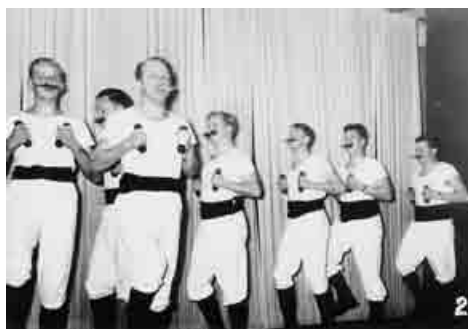
Die Faschings-Turnerkränzchen erfreuten sich bei der Bevölkerung großer Beliebtheit.

Der Alltag im Probelokal war streng geregelt. Ab 1928 probten die „Zöglinge“ zweimal pro Woche, von 19.30 bis 21.30 Uhr, die Mitglieder ebenfalls zweimal pro Woche von 20 bis 22 Uhr. Da einige der Zöglinge nach der Probe nicht sofort nach Hause gingen und sich