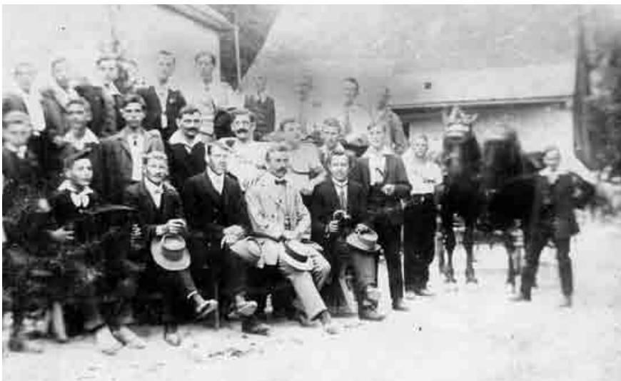
1919 unternahmen die Mitglieder der Turnerschaft Gisingen einen gemeinsamen Ausflug nach Röthis.