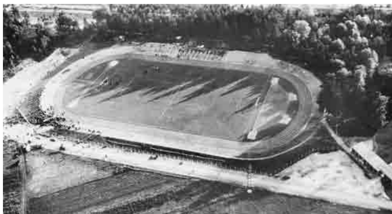
Im Auwald der Ill wurde Anfang der 50er Jahre das Feldkircher Waldstadion gebaut - hier eine Aufnahme von 1954.