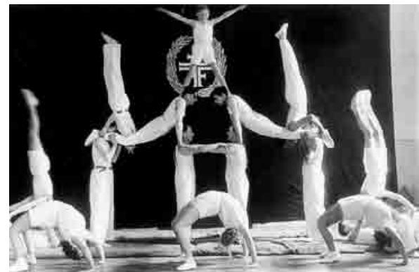
Auch spektakuläre Akrobatik-Übungen zählten mitunter zum Repertoire der TS Gisingen.